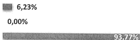
Quadro n.º 57 - Demonstrativo dos saldos por fonte de recurso